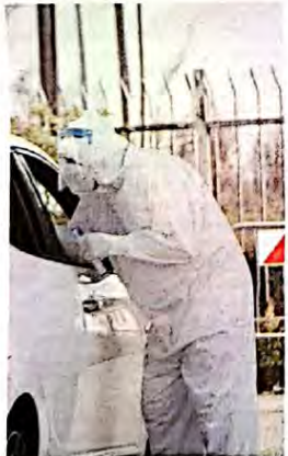
Grazie ai tamponi, è possibile effettuare il tracciamento della presenza del virus sul territorio.

Nella giornata di ieri l'Asp di Ragusa ha reso noti i dati degli screening effettuati nella giornata di mercoledì quando, in provincia, era aperto solo il drive-in di Ragusa. Nella postazione del centro direzionale Asi, sono stati effettuati 134 tamponi rapidi e non è risultato nessun positivo. Tre dici test sono stati effettuati nella postazione di Giaratana (non contemplata tra i drive-in) e, anche in questo caso, non sono state riscontrate persone positive al Covid 19. Infine, 1234 test rapidi, sempre nella giornata del 12 maggio, sono stati eseguiti nelle strutture ospedaliere e territoriali della provincia di Ragusa e, in questo caso, sono risultati 8 positivi. Tra le persone che si sono sottoposte a tampone rapido, 50 appartenevano alla popolazione scolastica.