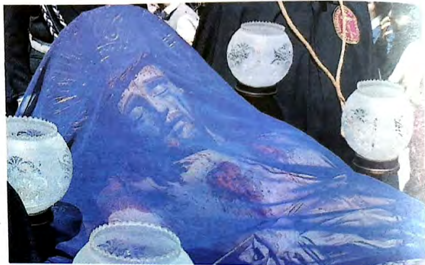
● Il Cristo morto durante la processione del Venerdì santo a Vittoria

la Passione, l'amorevole mano della Congregazione del Santissimo Crocifisso non è mai mancata. I confrati infatti, benché privi del rito corale della processione sia del mattino quando il Cristo con il suo cataletto giungeva in piazza Sei Martiri sia di quella serale, al seguito delle Parti, con il ritorno del Cristo morto in basilica, hanno reso ancora suggestivo e denso di commozione il Venerdì Santo. Devoti e spettatori hanno potuto assistere e partecipare alla Sacra Rappresentazione collegandosi con la pagina social della basilica di San Giovanni.