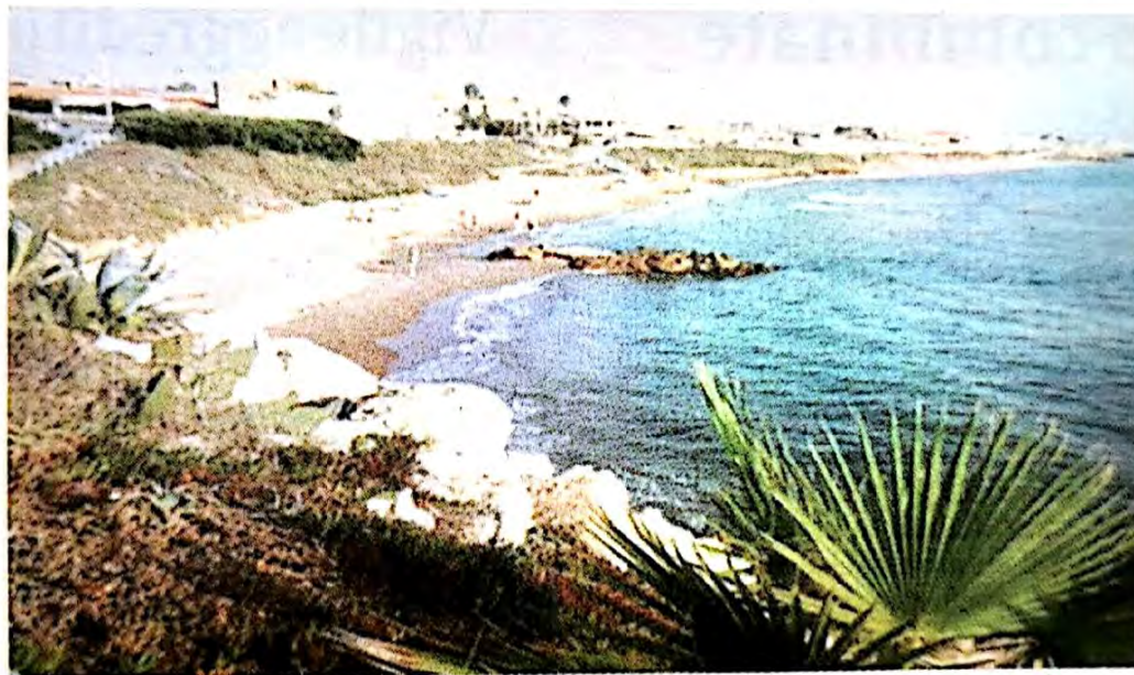
Una parte di Baia Dorica nella frazione rivierasca di Scoglitti

mentele degli scoglittiesi - scrive Francesco Tarascio - chiediamo un incremento dei controlli e una maggiore presenza delle forze dell'ordine a Scoglitti. I cittadini, ol-