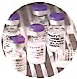
Fornitura. Arrivate 9 mila dosi di Pfizer, ripartita a pieno ritmo l'attività costretta ad una frenata.