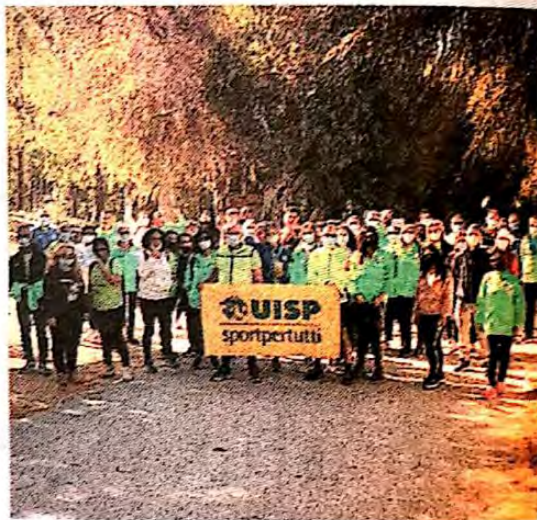
I Walkers Vittoria a Randello