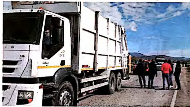
La Tekra ha ampliato il proprio parco mezzi da quando è attiva a Vittoria