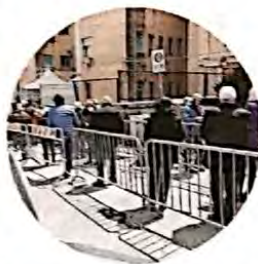
Corsie. Una per i prenotati, un'altra per gli over 60 non prenotati e una terza corsia a chi ha già compilato il modulo per l'anamnesi obbligatoria.

positivamente. Abbiamo avuto tra l'altro, da parte dell'Usca, un elenco di soggetti non ambulabili, si tratta degli over 80 che si sono prenotati ma non ancora raggiunti da chi era stato incaricato di effettuare le somministrazioni a domicilio. Per prima cosa, quindi, stiamo cercando di snellire questo elenco: successivamente faremo gli over 80 che non si erano prenotati, sempre a domicilio, e poi dovremmo iniziare a vaccinare gli over 80 che possono venire nei nostri studi. Se poi ci sarà la disponibilità delle dosi, inizieremo a vaccinare i soggetti estremamente fragili a domicilio. Al momento abbiamo a disposizione il Moderna, ma ritengo che in una seconda fase potremo disporre anche di AstraZeneca, ma questa, ovviamente, non è una scelta che spetta a noi. Finora debbo dire che la risposta è positiva e i pazienti dei medici di medicina generale che per svariate ragioni non hanno aderito all'iniziativa, saranno vaccinati da altri medici che fanno parte dell'associazione. Sono convinto che da qui a 15 giorni gli over 80 non ambulabili saranno vaccinati tutti".