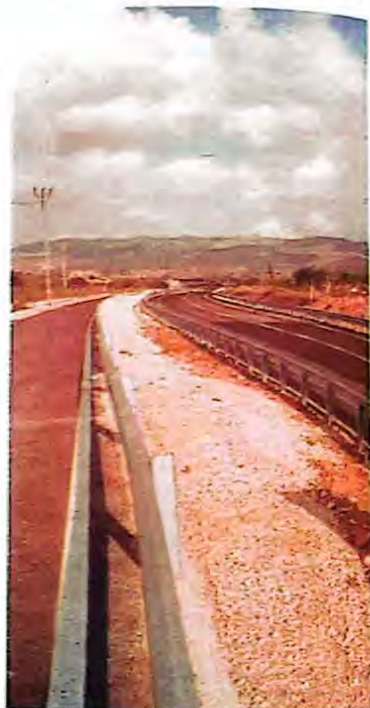
La bretella dell'area aeroportuale