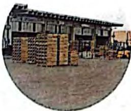
Vittoria. Mugnas (Reset) propone di avviare un secondo drive in per i test rapidi al mercato ortofrutticolo, in aggiunta a quello attivo all'ex Emala.

Ecco la situazione dei contagi, per Comune, confrontata con il giorno precedente: Acate 4 (+2), Chiaramonte 3 (-), Comiso 15 (-1), Giarratana 11 (-), Ispica 5 (-), Modica 10 (-2), Monterosso Almo 0 (-), Pozzallo 18 (+4), Ragusa 61 (-2), Santa Croce Camerina 7 (+1), Scicli 16 (+6), Vittoria 110 (-2). Rimane stabile il numero dei ricoverati che sono 17 così distribuiti: 12 in Malattie Infettive, 1 in Area Grigia e 4 in Terapia Intensiva. Per concludere, sono 7.741 (1 in più di ieri) le persone ragusane guarite dal Coronavirus dall'inizio della pandemia. Alla data di ieri, poi, erano 315.042 in totale (2252 in più rispetto al bollettino del giorno precedente) i tamponi effettuati in provincia di Ragusa dall'inizio della pandemia.