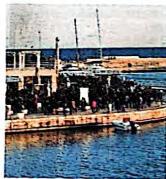
Gli assembramenti al porto turistico di domenica scorsa e, sopra, la riunione tenutasi in Prefettura.