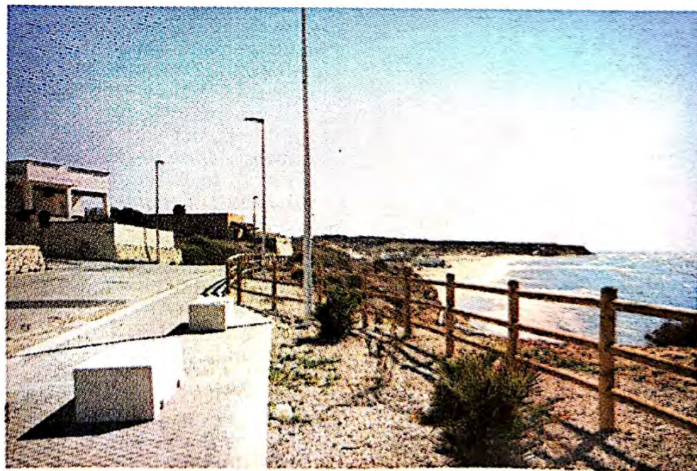
Il lungomare di Kamarina dopo la sistemazione