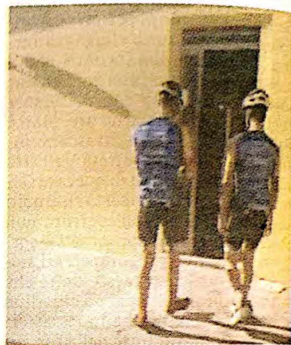
Due atleti dell'Asd Multicar Amarù in ritiro per pianificare con la massima attenzione la stagione 2021.