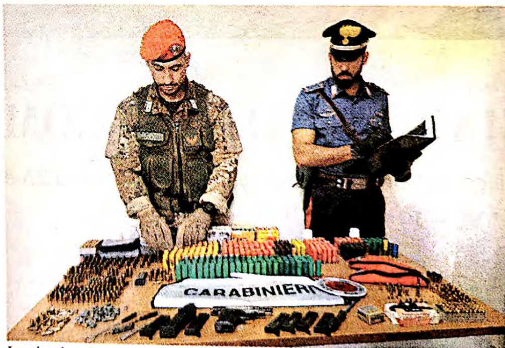
La pistola e le munizioni di vario calibro rinvenute dai carabinieri

Le indagini sono suscettibili di ulteriori sviluppi operativi in quanto l'attività che è stata svolta nella stessa giornata di giovedì si inquadra nell'ambito di una mirata ed efficace azione di contrasto ai traffici illeciti che l'Arma dei Carabinieri sta effettuando in tutto il territorio ragusano, e che dall'inizio dell'anno ha già ottenuto importanti risultati operativi. I controlli continueranno ancora nei prossimi giorni e nelle prossime settimane, su disposizione del comandante provinciale dei carabinieri di Ragusa, Gabriele Gainelli.