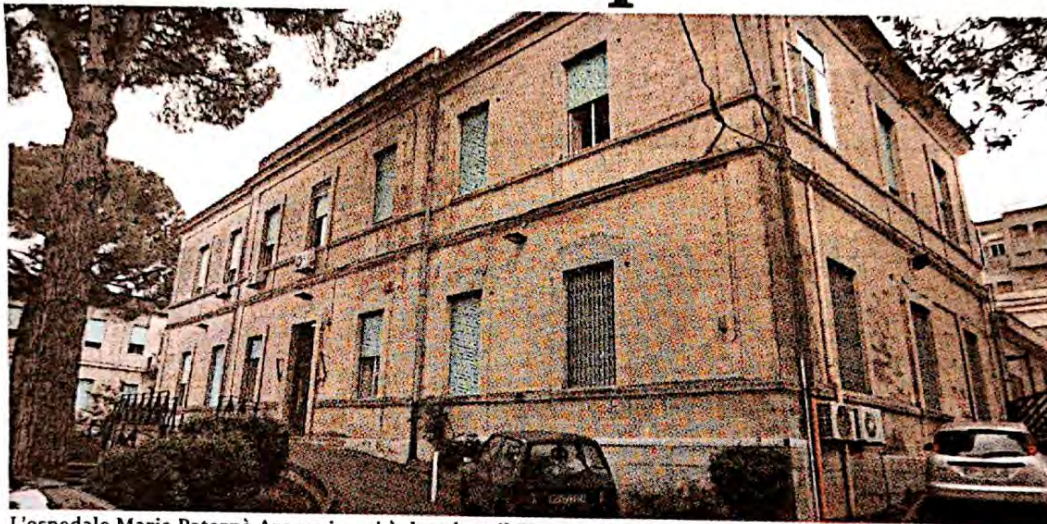
L'ospedale Maria Paternò Arezzo in cui è deceduto il 57enne vittoriese

zioni, è spirata mercoledì 2 settembre. Sulla salma la struttura ospedaliera ha disposto il riscontro diagnostico autoptico per stabilire le cause del decesso, che è stato effettuato giovedì 3 settembre. I figli della signora, attraverso il consulente personale Salvatore Agosta, per essere assistiti si sono rivolti a Studio3A-Valore S.p.A., società specializzata a livello nazionale nel risarcimento danni e nella tutela dei diritti dei cittadini, e sono decisi a presentare un esposto all'autorità giudiziaria perché faccia piena luce i fatti, verifichi il rispetto delle norme anti-contagio all'interno della struttura e accerti tutte le responsabilità dei dirigenti, dei medici e degli operatori della casa di riposo