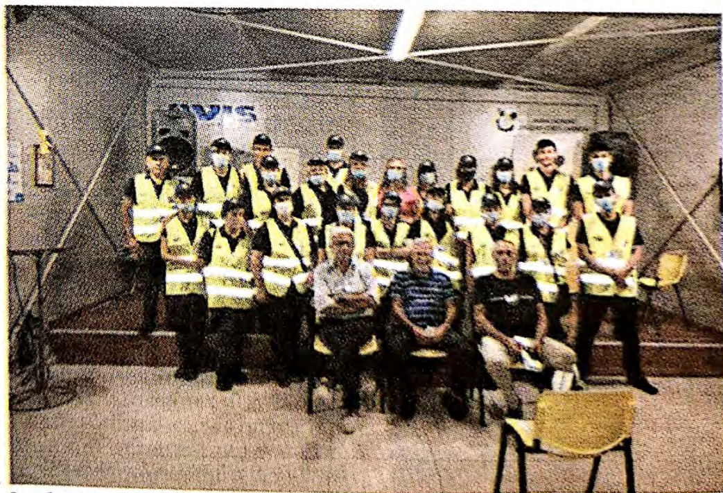
I volontari all'opera nei vari istituti

preparati professionalmente, immessi in servizio di volontariato dopo avere raggiunto una specifica formazione ottenuta dall'aver superato un corso di preparazione professionale” precisa il presidente Appl sottolineando la necessità di mettere a punto alcune cose anche se i volontari sono stati tutti promossi a pieni voti dai cittadini. “A parte alcune prevedibili anomalie che si tenterà di correggere con la collaborazione delle Scuole e della Polizia Municipale, la presenza dei volontari in ogni scuola sembra avere suscitato delle ottime impressioni nella cittadinanza - conclude Piccione - Si auspica ora di migliorare questo servizio di volontariato aumentando il numero degli operatori Ovas sul territorio ed apportando i necessari adeguamenti”.