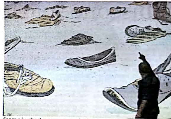
Sopra e in alto due scene tratte da Shuma

mani sabato 29 alle ore 20.00 - 20.30 - 21.00 e 21.30 (con due ulteriori repliche venerdì alle 19.30 e sabato alle 22.00) sarà Orazio Condorelli a guidare i partecipanti al suo laboratorio teatrale nello spettacolo "Vieni, andiamo in prigione noi due da soli canteremo come uccelli in gabbia" che mette in luce il complesso rapporto tra genitori e figli in una per-