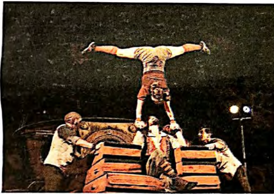
In scena lo spettacolo Oopart