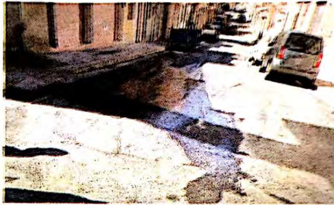
I liquami a cielo aperto in via Magenta