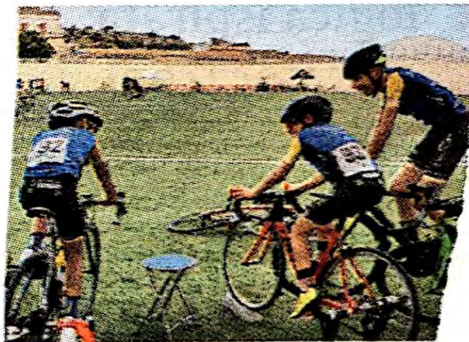
I gialloblù dell'Asd Multicar Amarù