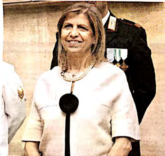
Il prefetto Filippina Cocuzza e a destra il sindaco Sebastiano Gurrieri

Vertice istituzionale ieri in Prefettura per individuare criticità e soluzioni in vista dell'apertura del nuovo anno scolastico. Il vertice è stato indetto dal prefetto di Ragusa Filippina Cocuzza su sollecitazione del dirigente scolastico provinciale Viviana Assenza, per fare il punto sulla situazione delle aule e sulle esigenze degli istituti scolastici in vista dell'apertura delle scuole per il prossimo 14 settembre. Per il Libero Consorzio Comunale di Ragusa ha partecipato il capo di Gabinetto Gianni Molè.