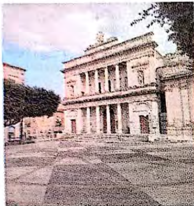
Piazza del Popolo

Tensione la notte scorsa nella piazza del Popolo. Mentre nel Chiostro della Madonna delle Grazie era in corso un concerto, un tunisino ubriaco dava sfogo a una singolare performance nella centralissima piazza lanciando bidoni della spazzatura all'indirizzo della gente. Comprensibile la paura dei presenti che assistevano alle intemperanze del nordafricano strafatto di alcol oltre il normale. Secondo le prime dichiarazioni rese da molti testimoni, inizialmente si era parlato di una megarissa ad opera di cittadini romeni ubriachi. I carabinieri, che sono intervenuti in piazza a seguito di segnalazione, non confermano la no-