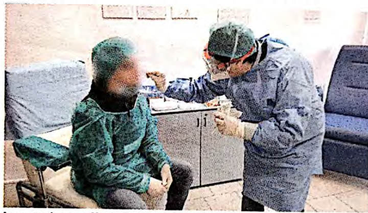
I tamponi sono effettuati con costanza anche in provincia di Ragusa