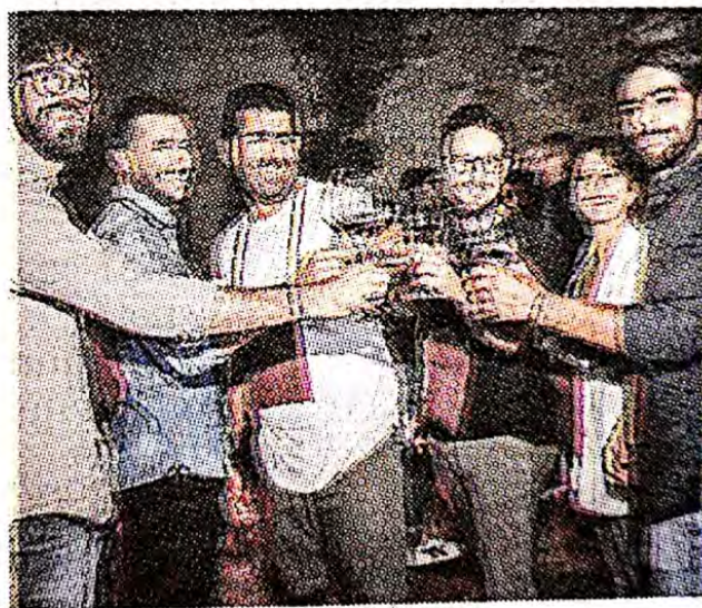
Alcuni winelovers a Medinwine

Medinwine diventa settembrina e sceglie come location d'eccezione il giardino di palazzo Iacono più che mai desideroso di aprire le sue porte alla città. La seconda edizione della rassegna di vini che continua a portare la firma della città di Vittoria e viene organizzata da Vittoria Mercati e Vittoria Fiere sarà presentata giovedì 24 settembre alle 10 nella Sala degli Specchi di Palazzo Iacono con l'intento di fare illustrare ai suoi protagonisti il variegato programma dell'evento che, ideato per valorizzare il vino, uno dei prodotti principi del territorio siciliano, ha anche molta voglia di raccontare l'arte, la storia, la bellezza dei luoghi. Quanto alla data Medinwine si terrà questo fine settimana, 26 e 27 settembre e, ovviamente, si svolgerà