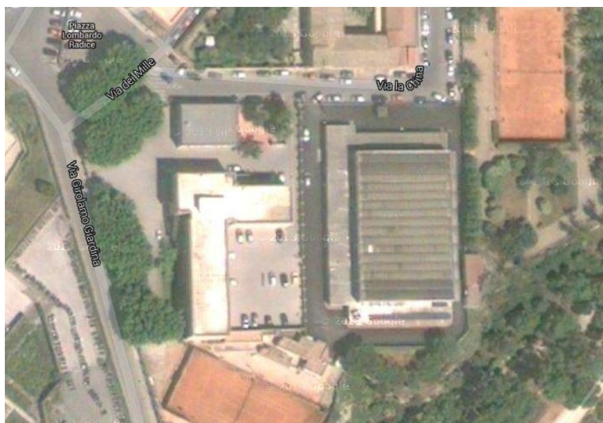
Fig.1 Foto satellitare dell'area in cui insiste l'immobile dove verrà installato l'impianto

In base alla potenza dell'impianto si stima pertanto che la produzione elettrica sarà di circa 20.600 kW/h.