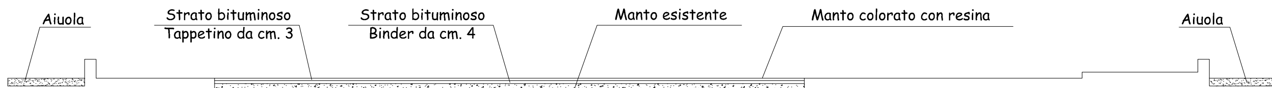
SEZIONE A - A'