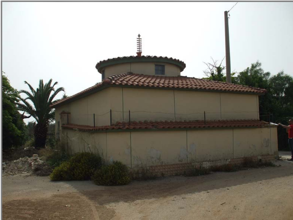
FOTO N. 3 - Vista posteriore