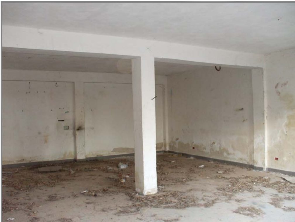
FOTO N. 4 - Vista interna