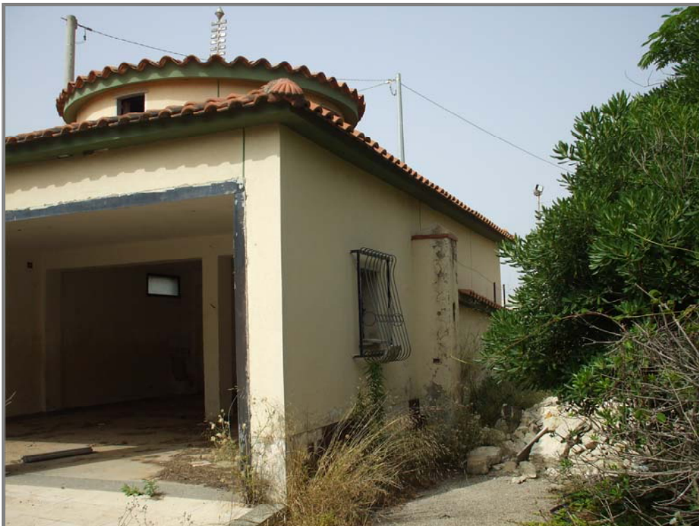
FOTO N. 2 - Vista laterale